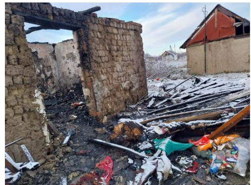
Brand op het Romakamp