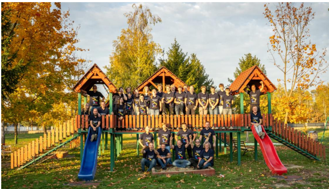
Klusgroep uit Meppel oktober 2025

We geven voorlichting over het werk in Oekraïne en stimuleren de betrokkenheid van jongeren door het organiseren van reizen.