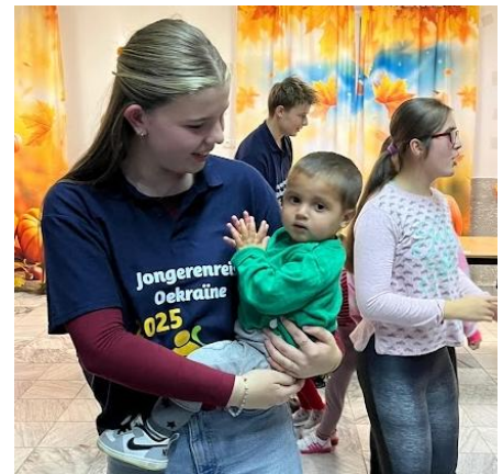
Jongeren uit Nederland klussen en spelen

Tijdens de voorbereidingen was er steeds het voorbehoud van de veiligheid in verband met de oorlog, maar op 25 oktober 2025 konden ze toch gaan. Moe, maar voldaan en vol indrukken kwamen de deelnemers na een intensieve week veilig terug in Nederland.