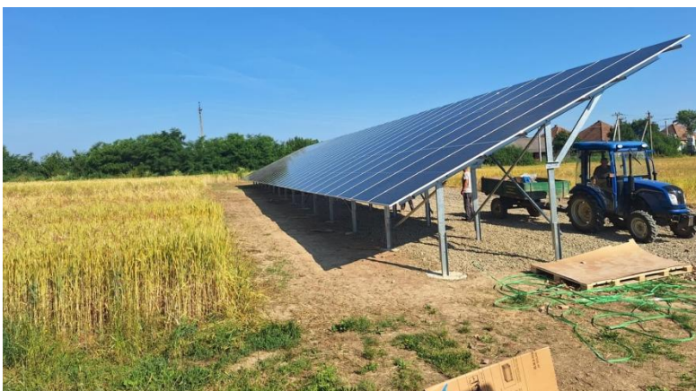
Gesponsorde zonnepanelen en batterijen

We zijn dankbaar dat we met steun en betrokkenheid van velen en met de zegen van God veel hebben kunnen doen in het voorbije jaar, ondanks de voortdurende staat van oorlog in Oekraïne.