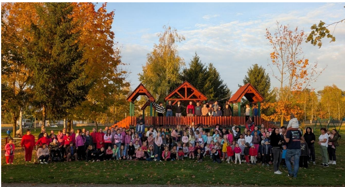
Alle bewoners van het kindertehuis – oktober 2025